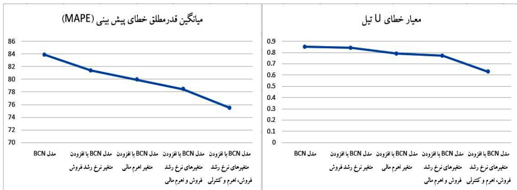
شکل (۲): نمودار مقایسه ای خطای پیش‌بینی مدل‌های پژوهش

همانطور که در نگاره فوق پیداست، در هر مرحله، با افزودن متغیرهای مرتبط با پیش‌بینی به مدل BCN، میزان خطای آن کاهش یافته است. به نحوی که میانگین قدرمطلق خطای پیش‌بینی (MAPE) و U تیل مدل BCN با کاهشی معنی‌دار به ترتیب از ۸۳/۸۷٪ و ۰/۸۵۱ به ۷۵/۴۷٪ و ۰/۶۲۸ در مدل نهایی رسیده است. این مورد را در نمودارهای شکل زیر نیز می‌توان مشاهده کرد: