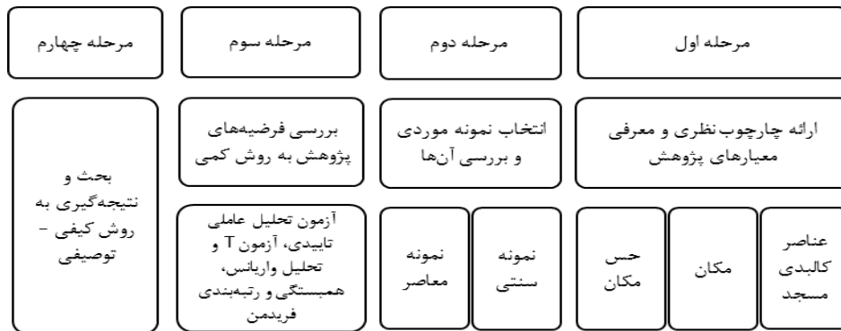
چارت ۱: دیاگرام روند تحقیق (منبع: نگارندگان)

این تحقیق از نوع کیفی - کمی و از لحاظ هدف کاربردی می‌باشد که داده‌ها و اطلاعات مورد نیاز، در مرحله اول به صورت کتابخانه‌ای و با استناد به کتب، مقالات و هم‌چنین آرای صاحب‌نظران در زمینه‌های مکان، حس مکان و سطوح آن گردآوری شده‌اند. ابزار مورد استفاده در این مرحله فیش‌نویسی بوده است. بدین ترتیب عوامل موثر و معیارهای سنجش حس مکان تعریف شده‌اند. سپس معیار مورد پژوهش این تحقیق، یعنی عوامل کالبدی در ساختار مسجد که در ارتقای حس مکان موثر به نظر می‌آیند، معرفی شد. در گام