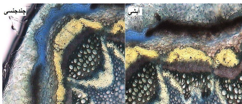
شکل ۱- آزمایش ترومر روی برش‌های عرضی ساقهٔ گیاه زندهٔ شکر تیغال‌های آیشی و چندجنسی (ساکاروز به رنگ آبی، مخلوط دکستروز و پروتئین به رنگ بنفش و اکسید مس به رنگ زرد مشاهده می‌شود).

محتوای فلاونوئید و آلکالوئید در اندام‌ها و مان ترهالای دو گونه تقریباً یکسان بود. مطابق یافته‌های این تحقیق میزان فلاونوئید در عصارهٔ متانولی شاخسارهٔ شکر تیغال چندجنسی ۵/۷۳ میلی‌گرم بر گرم مادهٔ خشک و در شکر تیغال آیشی ۵/۲۵ میلی‌گرم بر گرم مادهٔ خشک بود. این در حالی است که محتوای فلاونوئید