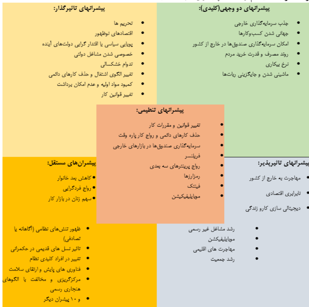
شکل ۵ - گونه‌شناسی پیشمرانه‌های اثرگذار بر آینده صندوق‌های بازنشستگی، بر اساس موقعیت قرارگیری در نمودار اثرگذاری - اثرپذیری

اختیار صندوق‌های بازنشستگی و دولت قرار می‌دهد که بتوانند با به کارگیری و اعمال تغییر در این متغیرها، شرایط سیستم را سمت پایداری مثبت هدایت کنند.