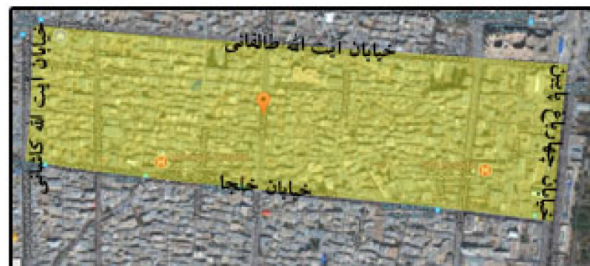
شکل ۱. معرفی و تدقیق سطح مطالعاتی (محله خلجای اصفهان)